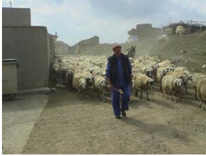
Zo kom ik ze regelmatig tegen.....