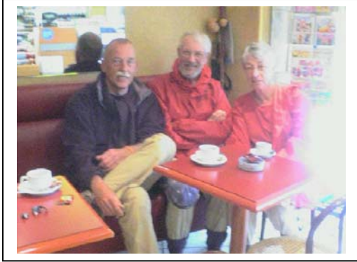
St.Jacobiparochie meets Drachten