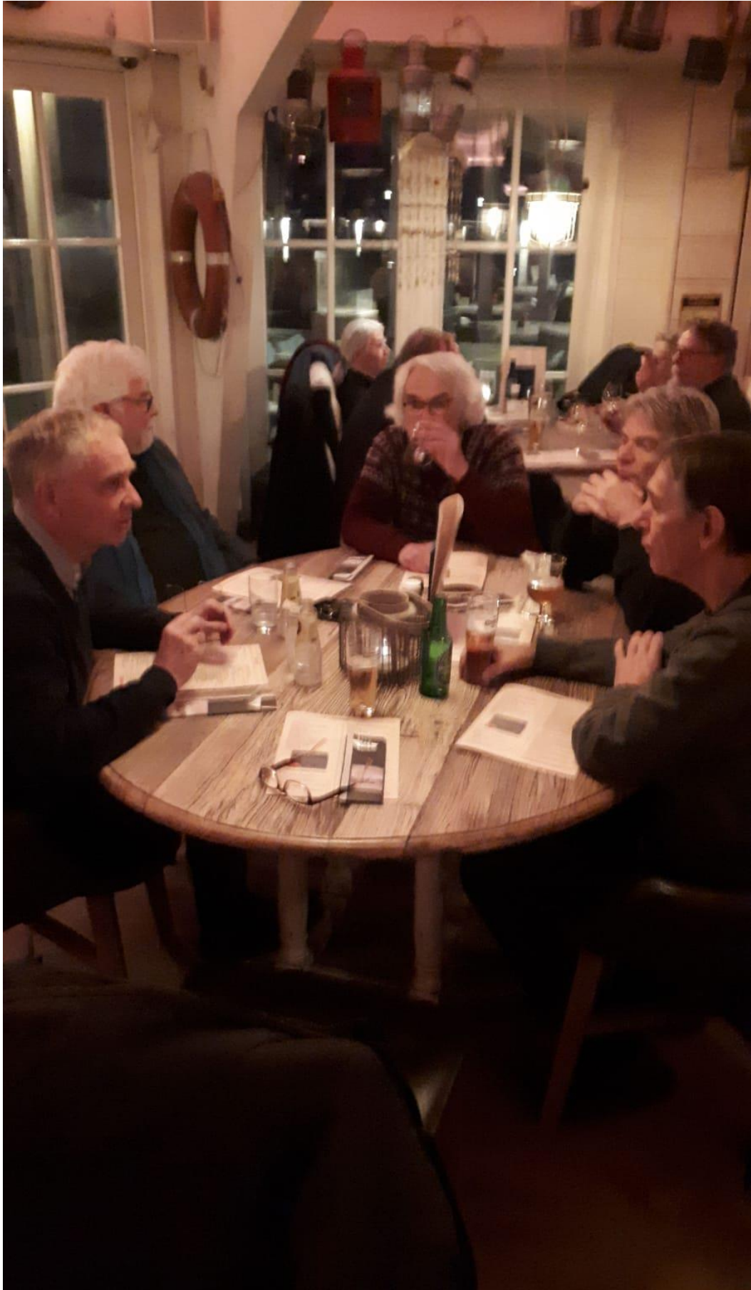
Eerste kleine evaluatie. Zie ook hieronder.