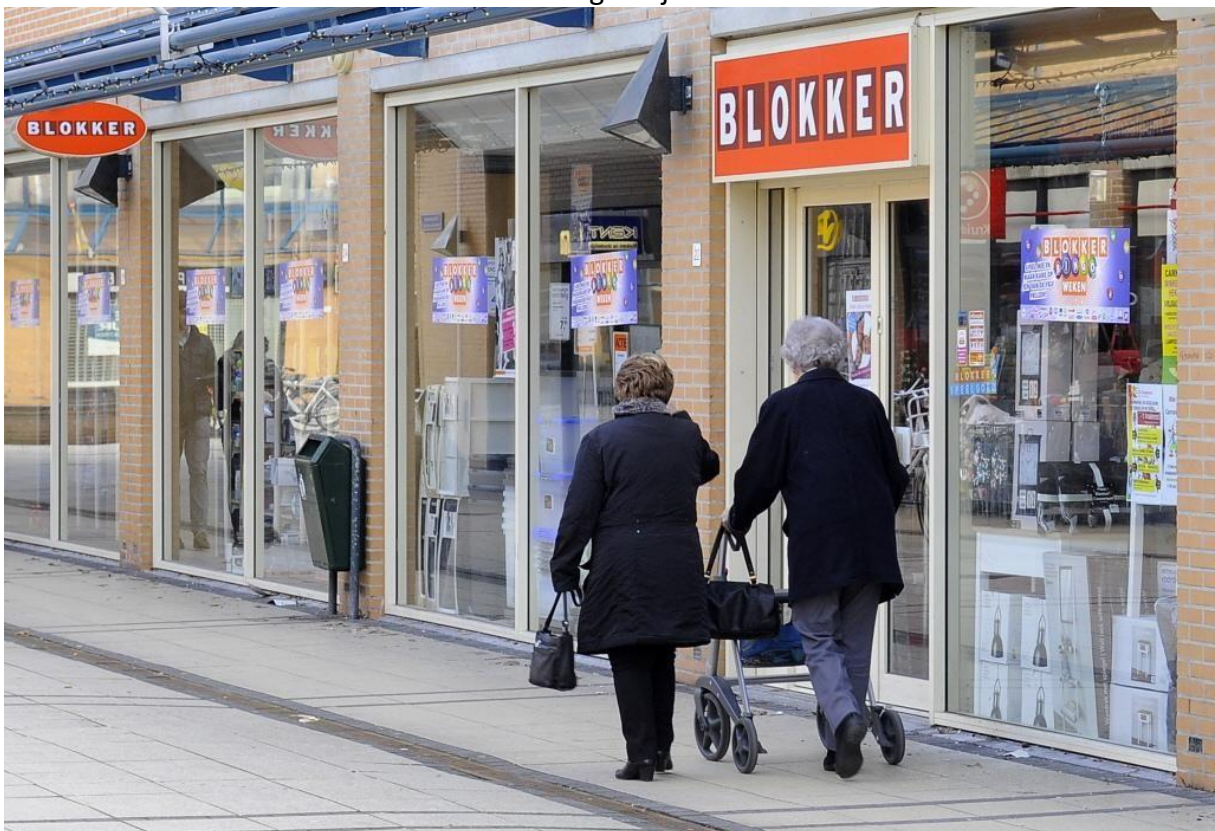
potten en pannen en touw