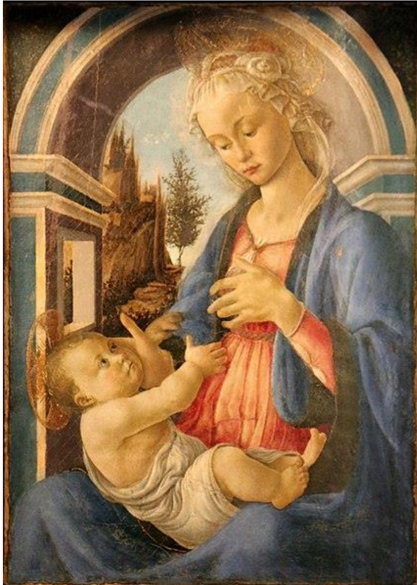
het Musée du Petit Palais. Botticelli.