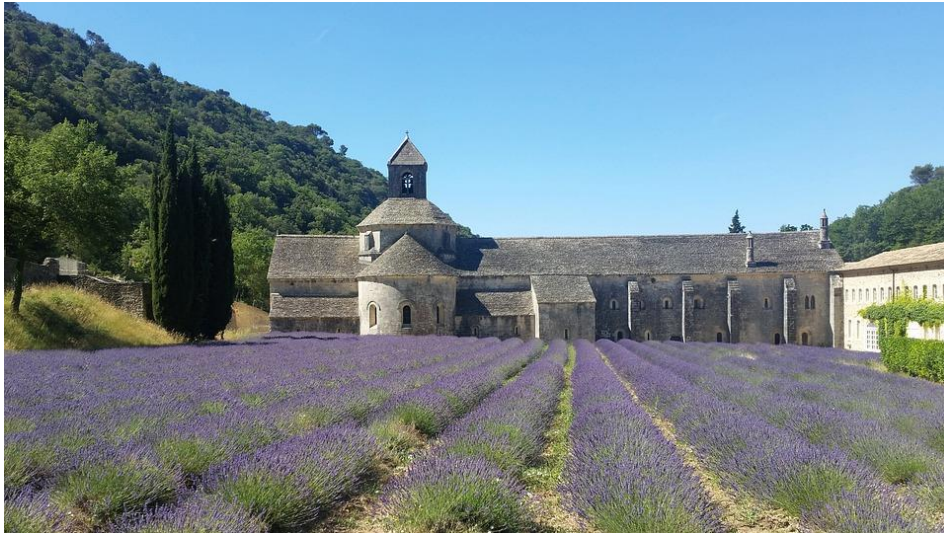
de Abbaye Notre-Dame de Sénanque

De laatste etappe naar Fontaine de Vaucluse gaat langs de Abbaye Notre-Dame de Sénanque. Gesticht in 1148 en bekend met een roerige en bloederige geschiedenis. Momenteel een contemplatieve gemeenschap van biddende cisterciënzer monniken. De plaatjes van de abdij met de bloeiende lavendel in de kloostertuinen zijn wereldberoemd. Een gemeenschap van een heel andere orde is les Bories et Spa : een “welzijnsverblijf” waarin de verdieping vooral door de portemonnee en de aangeboden luxe wordt bepaald. Zo loop je van het ene uiterste naar het andere.