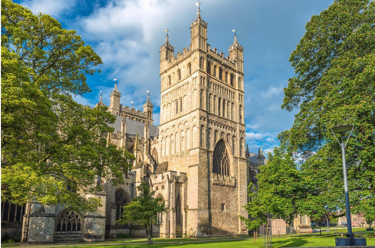
Kathedraal van Exeter

Een vliegreis met een heuse propeller-Bombardier van luchtvaartbedrijf Flybe - ook wel Maybe genoemd - vanaf Schiphol naar de hoofdstad van het graafschap: Exeter. Van hier met een bus naar het centrum van deze universiteits- en bisschopsstad. Met de mogelijkheid de stad nader te verkennen. Doen!