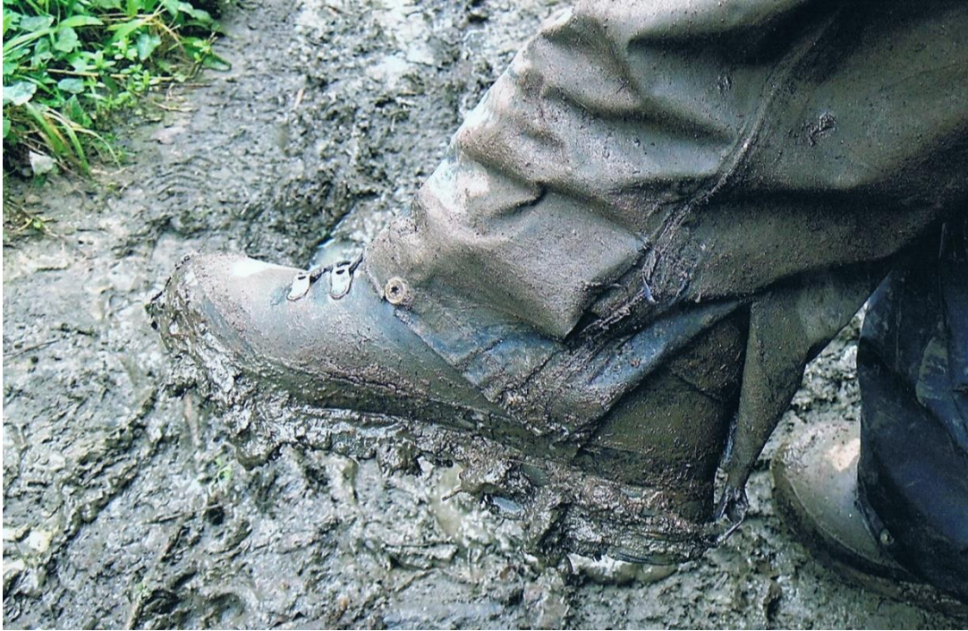
National Nature Reserve Downland Cliffs na regen