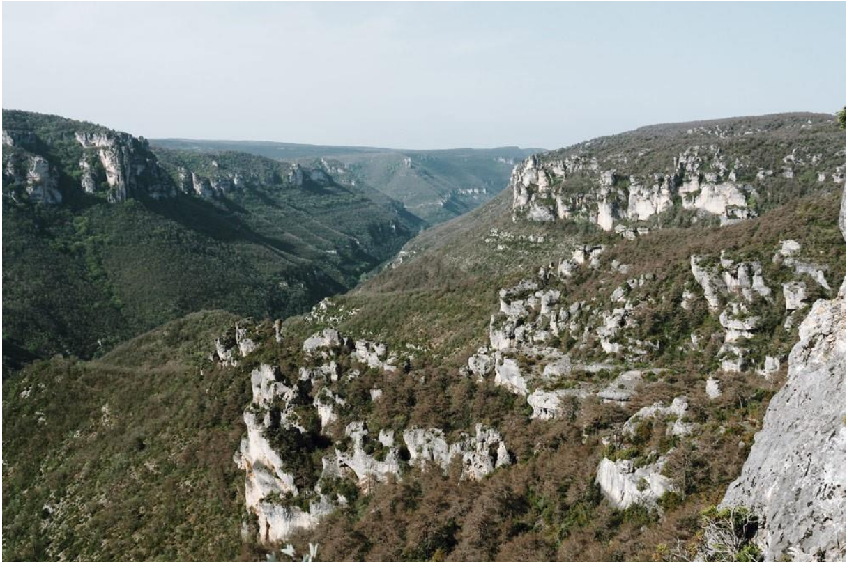
de chaos - la Cité de Pierres - de Montpellier-le-Vieux

deze maanlandschappen. En nog één keer de Jonte oversteken. Dus even flink dalen en weer klimmen.