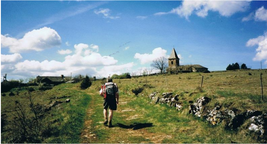
Veyreau Causse Noir