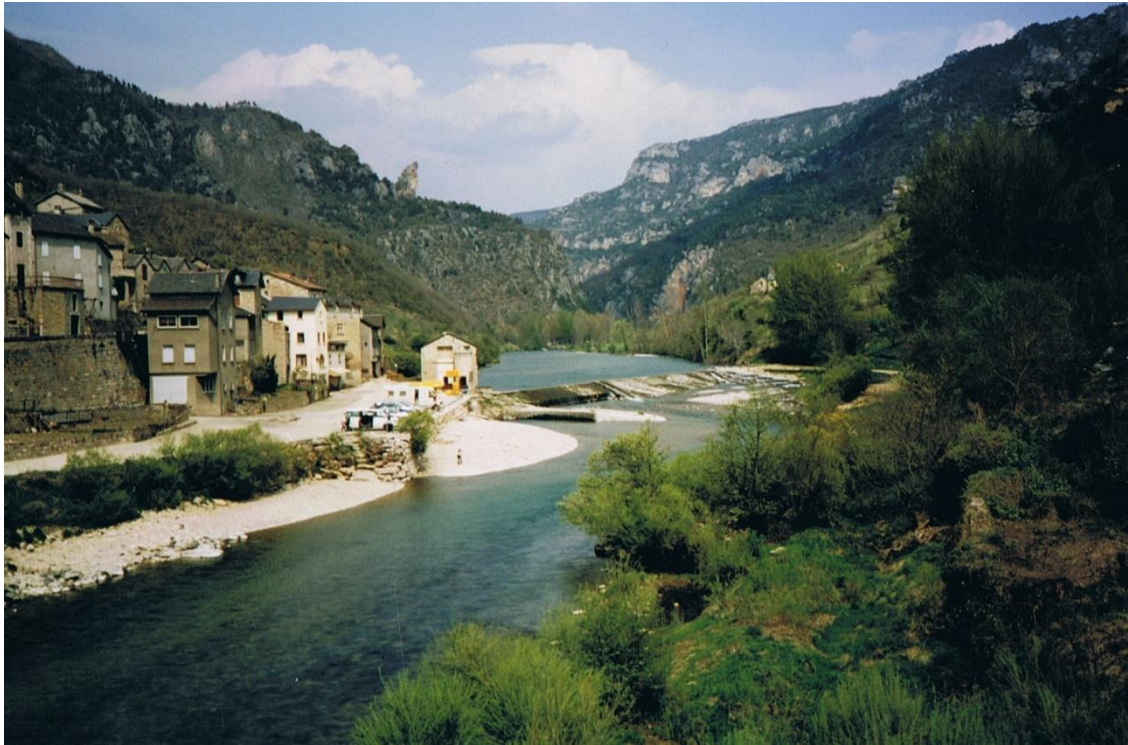
de Tarn bij les Vignes