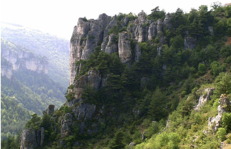
Gorge de la Jonte