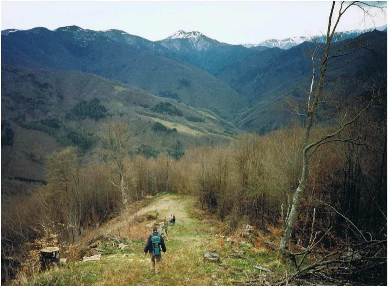
Afdaling naar Shipkovo