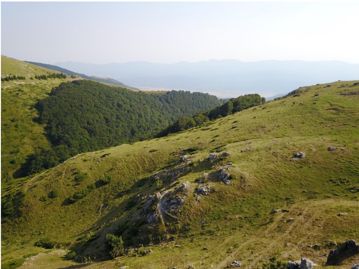
Beklemeto pas Bulgarije 1520m

Het viel ons al snel op dat het groepje wachtenden als op niet te lokaliseren commando's wegliep, een tijdje weg bleef en weer terugkwam. "Все още няма влак?", waarna ze nog rondrentelden en weer vertrokken. Om 6 uur sprongen we al een gat in de lucht toen er een locomotief met een goederenwagon aankwam. Waarna het groepje weer terugkwam. En weer verdween. Evenals de locomotief en wagon. Om 7 uur een nieuwe personenwagon, om half acht nog een en een kwartier later de diesellocc. Na 5 uur wachten op naar Boergas, nog vier uur te gaan! Per trein, deze keer. Wel eens met vier kippen in een mand naast je en al aardig moe uren in een trein gezeten?