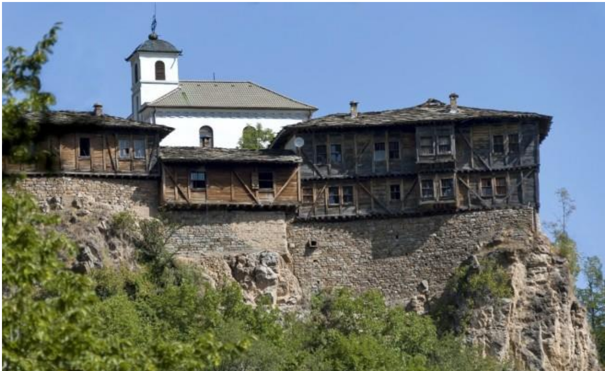
Glozhene klooster Stara Planina

Tot een wat oudere heer kwam aangelopen.