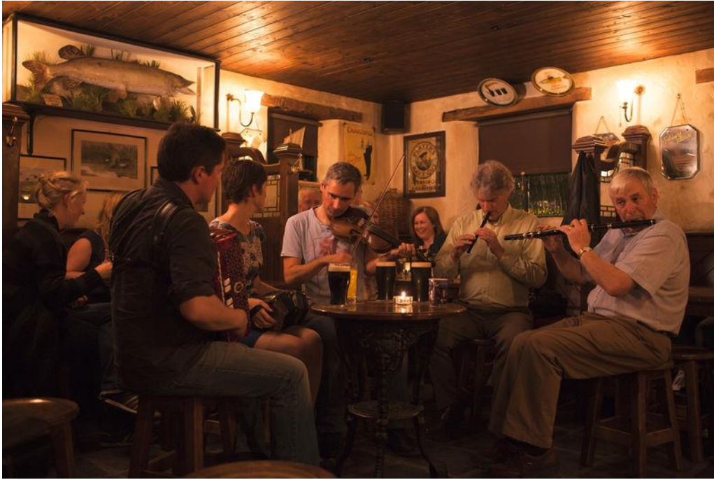
Folk music in de pub