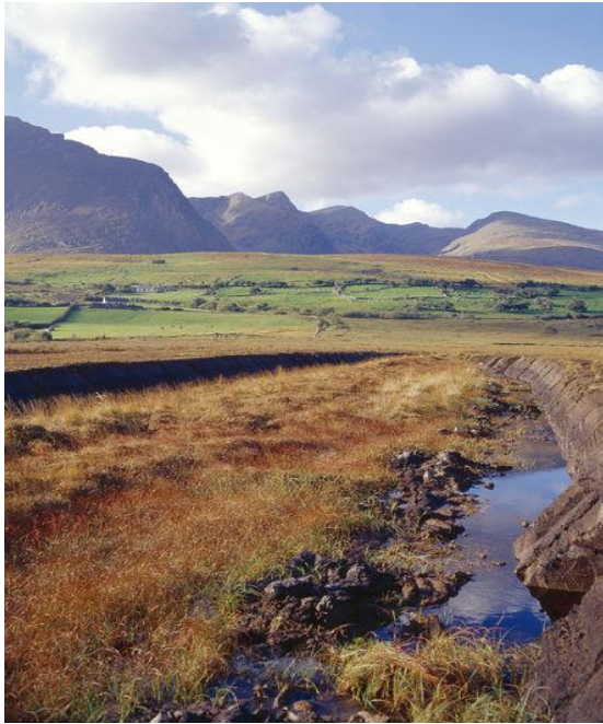
Brandon Mountain op Dingle

Maar, zoals gezegd, heb je zin in een lekkere klim dan is dat in ieder geval aan het ontbijt in de B&B makkelijk te realiseren.