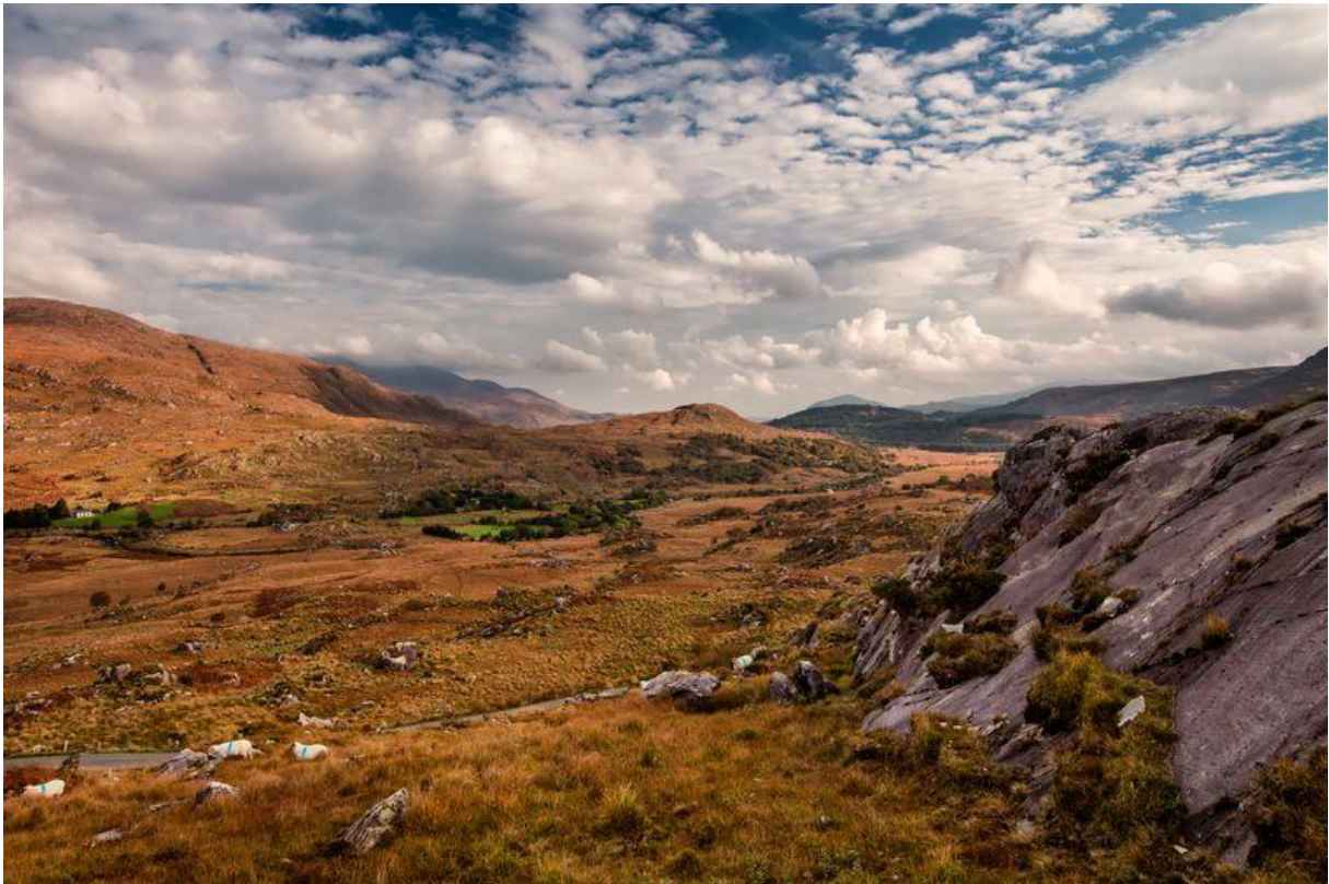
Kerry Black valley