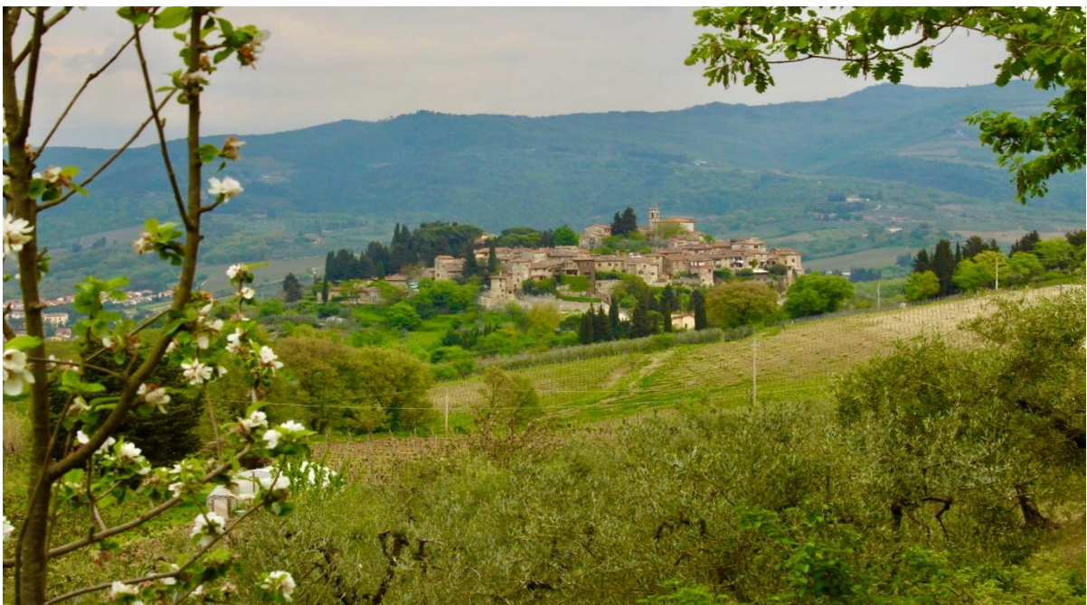
Tussen Greve in Chianti en Castellina in Chianti uitzicht op Montefioralle