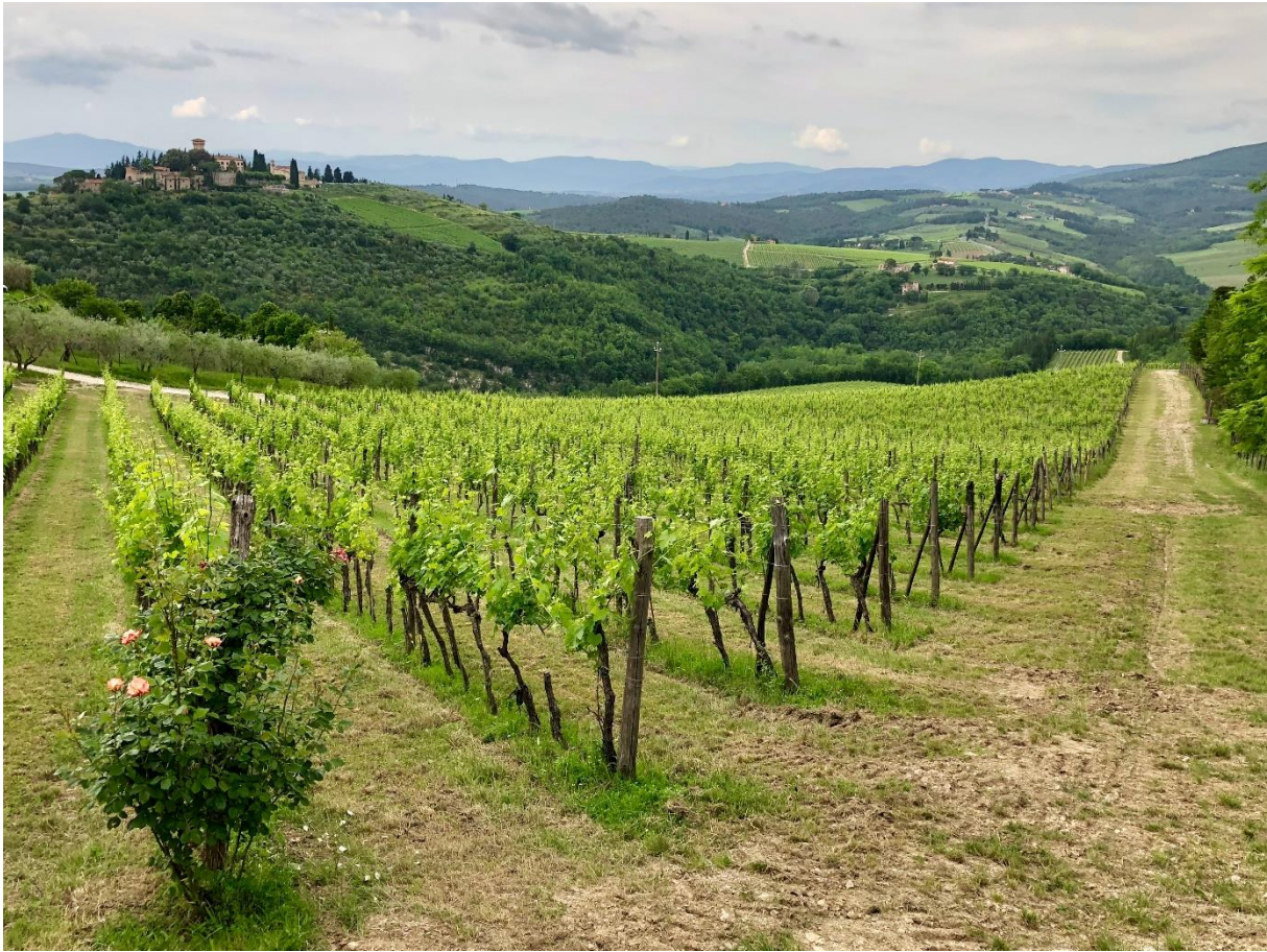
Zicht op Verrazzano kasteel