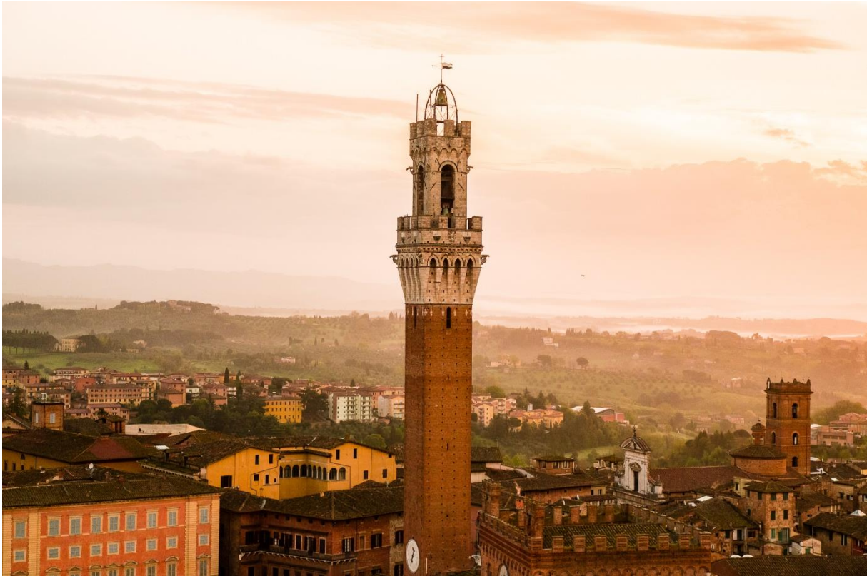
Torre Mangia Siena photos Municipality of Siena - by the Tourist Office"

Eveneens een bijzonder fraaie stad met een Middeleeuws centrum en in die periode ook de grote concurrent van Florence. Ook maar een dag voor uittrekken? Piazza del Campo? Duomo Santa Maria? Oratorio di San Bernardino?