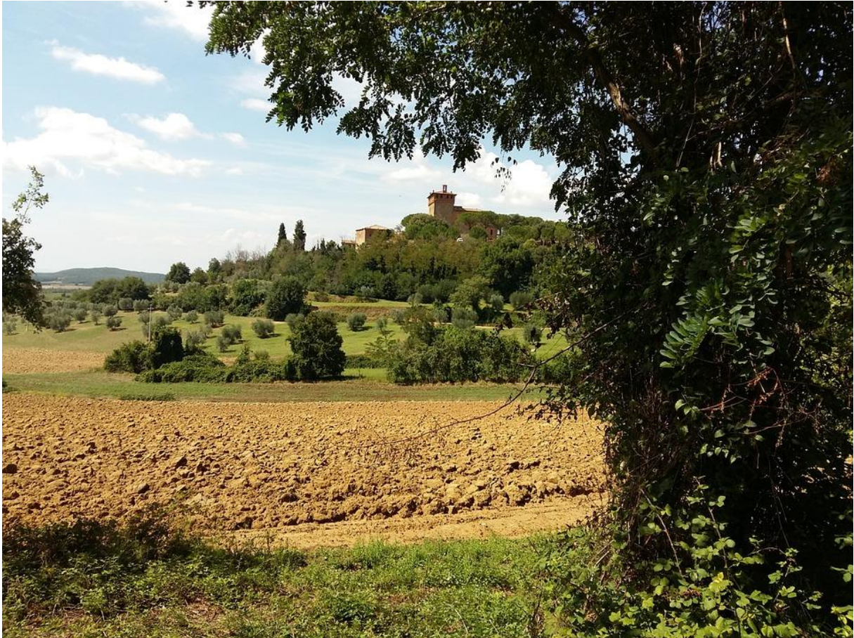
De boer en zijn land