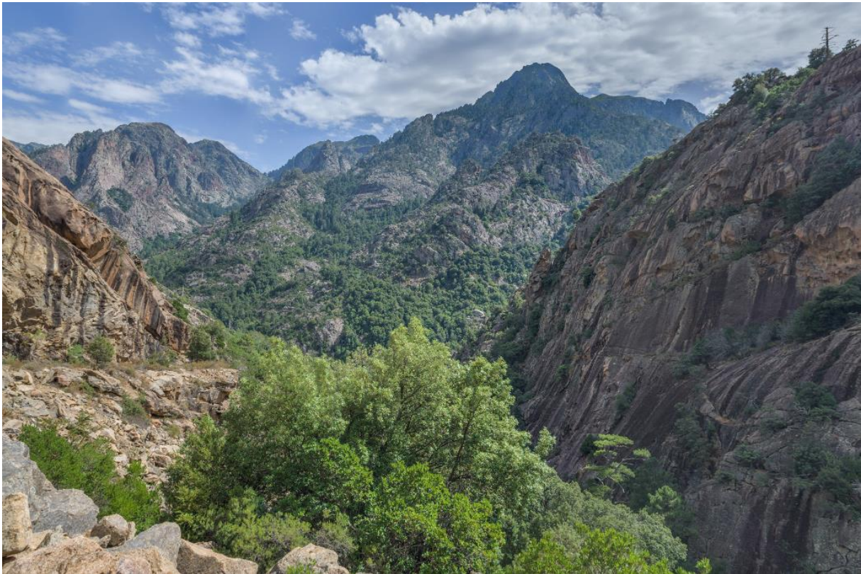
Forêt de Bonifatu