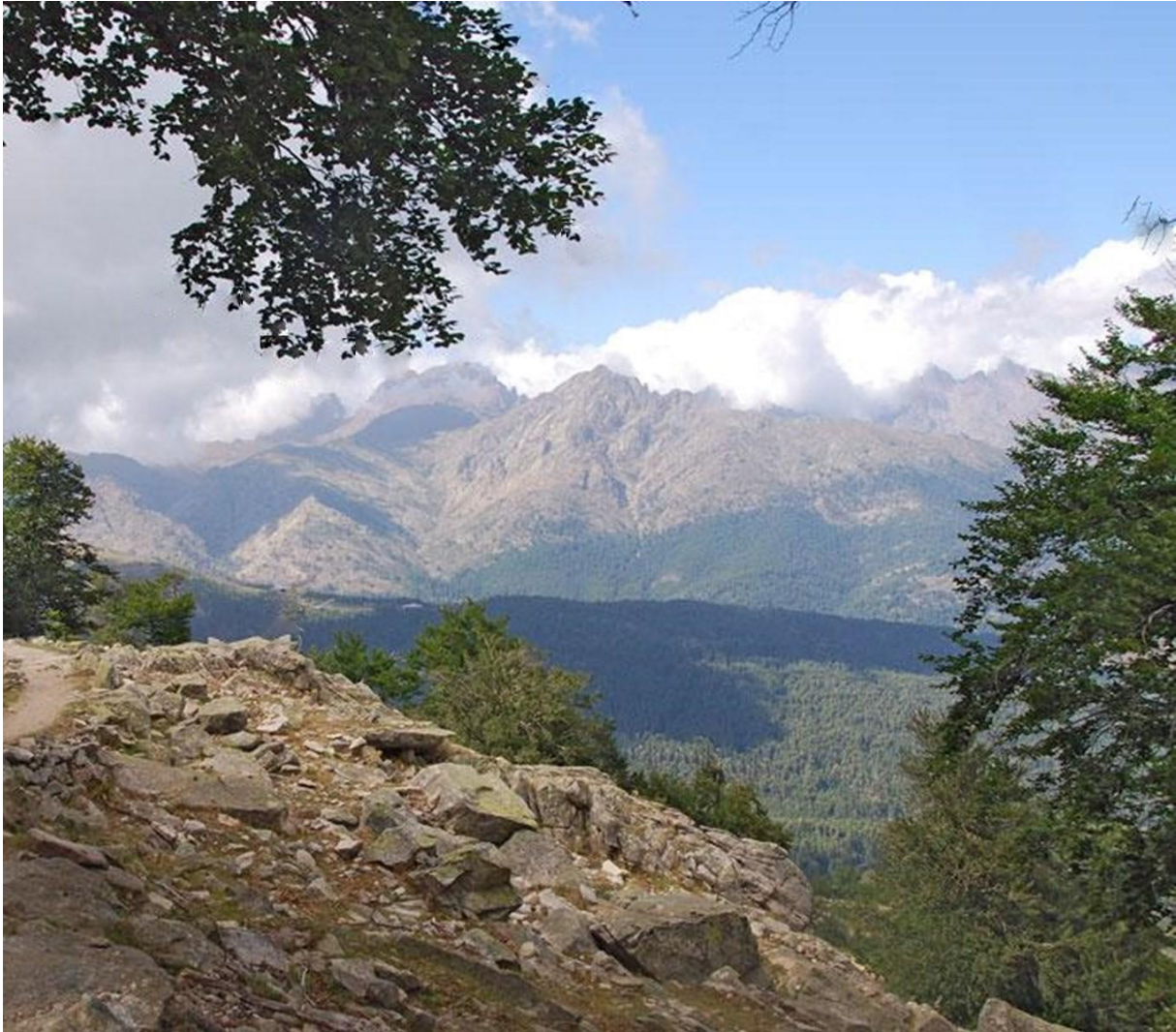
Uitzicht op de GR 20

We beschreven op deze website eerder al de Mare a Mare Sud . Hierna volgen enkele ervaringen met de Mare en Monti: zee en bergen.