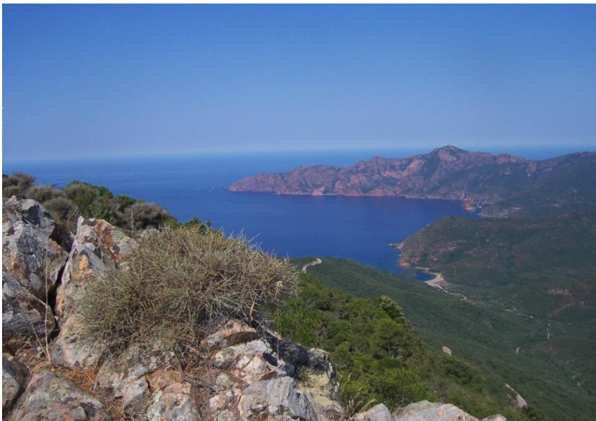
Bocca a Croce

In het dorp Tuarelli wandel je, komend uit het zuiden, over ponte Vecchiu (de oude brug over de Fango) de gelijknamige vallei in. Samen met het Forêt de Falasorma vormt de vallei van de Fango een Unesco biosfeerreservaat. De rivier die hier door de eeuwen heen haar weg heeft weten uit te slijten in de rotsen. Prachtig! In de groenblijvende vallei kun je de moeflon, de lammergier en de steenarend bewonderen.