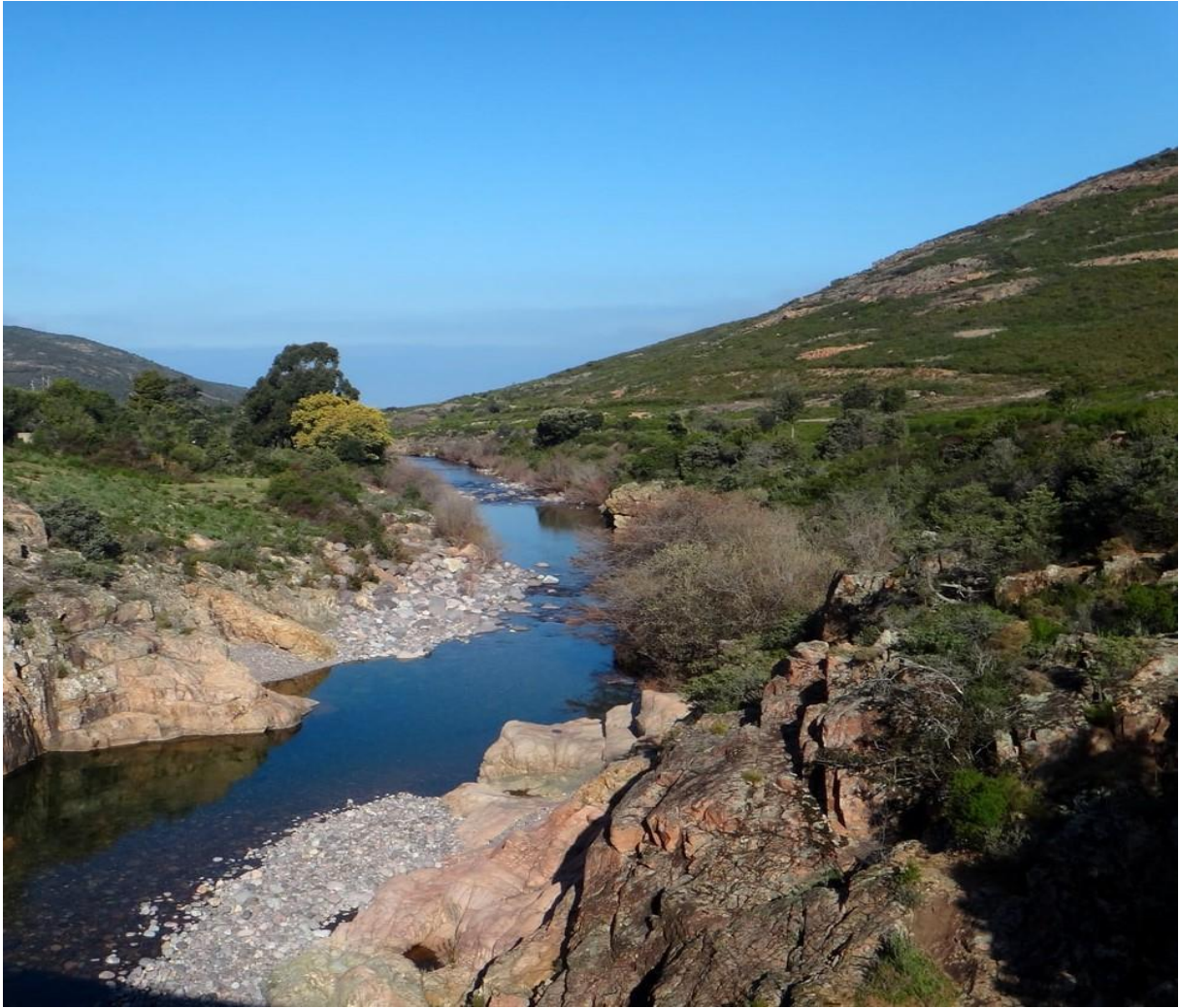
Vallei van de Fango rivier